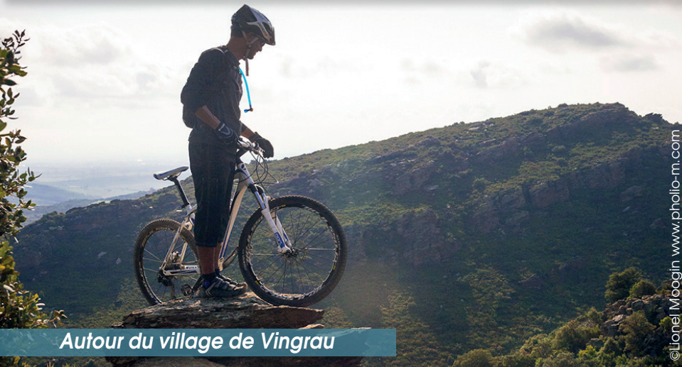
Autour du village de Vingrau