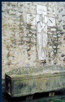
Le Sarcophage d'Arles-sur-Tech

C orsavy et Montferrer, deux villages de montagne proches et différents, adossés aux contreforts du Canigou, jouissent d'un magnifique panorama sur les Albères et la plaine du Roussillon. Corsavy, aux rues pavées s'enorgueillit de deux tours à signaux, l'une au village, l'autre à Batère et d'une Eglise St Martin (XII e s.) en cours de restauration. Montferrer possède une Eglise romane classée et les ruines d'un château (XI e s.). Ces deux villages, restaurés avec goût, sont la base de départ de nombreuses randonnées en moyenne et haute montagne.