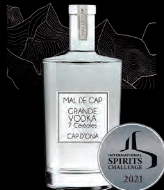
VODKA MALT D'ORGE «MAL DE CAP» AUX 7 CÉRÉALES