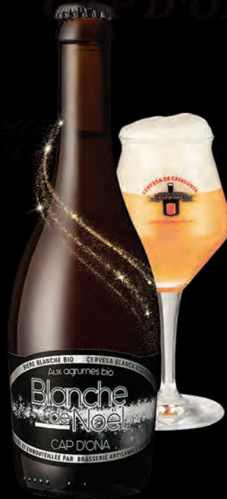
BLANCHE AUX AGRUMES