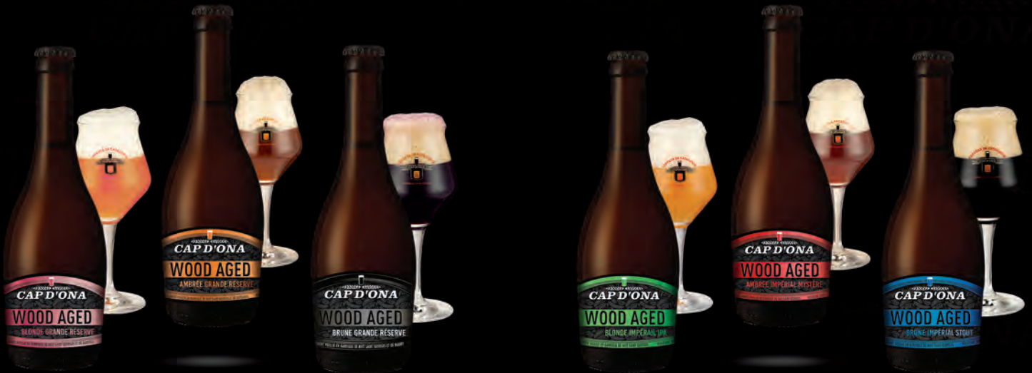
BLONDE GRANDE RÉSERVE BANYULS