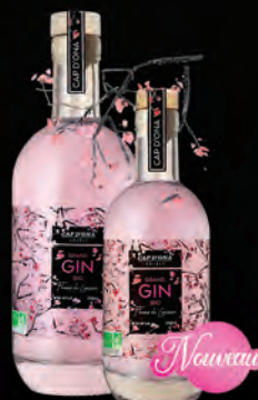
GIN BIO «FLEUR DE CERISIER» FAÇON PAYS DU LEVANT