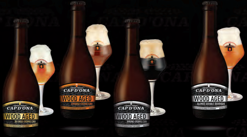
BLONDE GRAND CRU

Ces bijoux multi médaillés d'or vous invitent à un voyage initiatique dans le monde des bières d'exception : une féerie des sens.