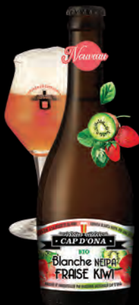
BLANCHE NEIPA FRAISE KIWI