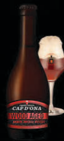
AMBRÉE IMPÉRIAL MYSTÈRE