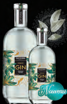
GRAND GIN «CAP DE DONA» AUX 30 BOTANIKES SAUVAGES

LES SPIRITUEUX Quintessence des créations CAP D'ONA, nos spiritueux sont le fruit de la distillation d'une sélection de nos bières et autres grands mouls de céréales élaborés par nos soins. La qualité de nos alcools réside dans la sélection des plus belles matières premières, un brassage exigeant, une double ou triple distillation lente ainsi qu'un très long vieillissement en foudre de vins doux naturels. Nous ne conservons systématiquement que l'ultra coeur de distillation afin d'assurer l'Excellence et la Magie des grands spirits.