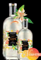
GIN BIO «Fraîcheur Agrumes» Botaniques et Ecorces d'agrumes