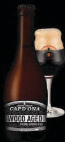
BRUNE GRAND CRU