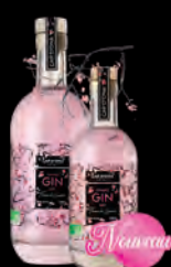
GIN BIO ROSÉ «Fleur de cerisier» façon pays du levant