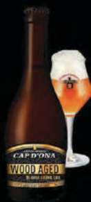
BLONDE GRAND CRU

Ces bières vieilles 12 à 36 mois en foudres de Nuits Saint Georges et de grands vins doux naturels sont le sommet de la créativité et de la technicité de la Brasserie CAP D'ONA. Ces bijoux multi médaillés d'or vous invitent à un voyage initiatique dans le monde des bières d'exception : Une invitation au plaisir, une féerie des sens.