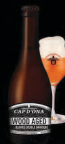
BLONDE DOUBLE BARRIQUE CHARDONNAY