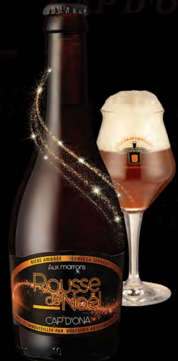
ROUSSE AUX MARRONS