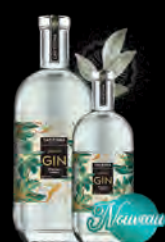
GRAND GIN «Cap de Dona» Botaniques sauvages

Quintessence des créations CAP D'ONA, nos spiritueux sont le fruit de la distillation d'une sélection de nos bières et autres grands moûts de céréales élaborés par nos soins. La qualité de nos alcools réside dans la sélection des plus belles matières premières, un brassage exigeant, une double ou triple distillation lente ainsi qu'un très long vieillissement en foudre de vins doux naturels. Nous ne conservons systématiquement que l'ultra cœur de distillation afin d'assurer l'Excellence et la Magie des grands spirits.