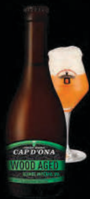
BLONDE IMPÉRIAL IPA