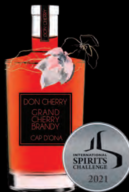
SPIRIT DE CERISE «DON CHERRY» AUX CERISES BIO DE CÉRET