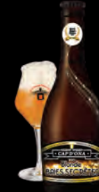
BLONDE BAIES SECRÈTES