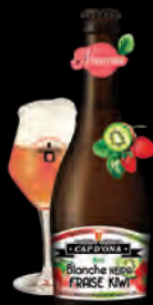
BLANCHE NEIPA FRAISE KIWI