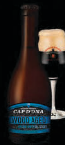
BRUNE IMPÉRIAL STOUT