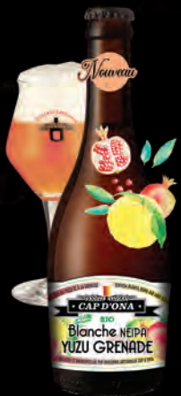
BLANCHE NEIPA YUZU GRENADE