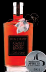
SPIRIT DE CERISE «Don Cherry» aux cerises bio de céret