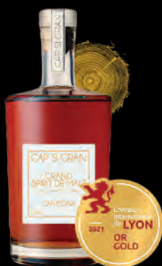
SPIRIT DE MALTS «CAP SI GRAN» VIEILLI EN FÛT DE CHÊNE