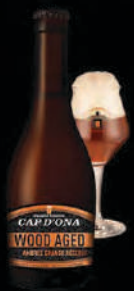
AMBRÉE GRANDE RÉSERVE RIVESALTES