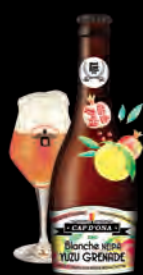
BLANCHE NEIPA YUZU GRENADE

Bières de plaisir d'une noblesse rare. Produites en série limitée, elles mettent en lumière notre beau terroir et ses trésors. Toutes nos bières aux fruits sont élaborées à partir d'un kilo de fruits bio locaux de saison pour un litre de bière brassée. Créations éphémères, 100% naturelles