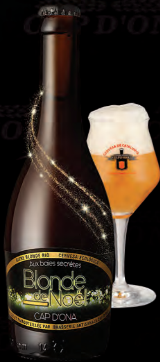
BLONDE AUX BAIES SECRÈTES

Trois bières luxueuses de Noël Blanche aux agrumes, Blonde aux baies secrètes, Rouse aux marrons Bières de grande dégustation, toutes les 3, médaillées à l'international. Joyau de Noël par excellence qui vous accompagnera de l'apéritif au digestif lors des fêtes de fin d'année.