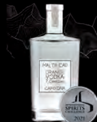
VODKA MALT D'ORGE «Mal de Cap» aux 7 Céréales