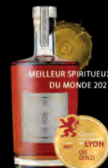
SPIRIT DE MALTS RÉSERVE 50 «Cap Si Gran» vieilli en fût de chêne