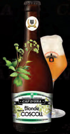
BLONDE LIQUEUR DE COSCOLL