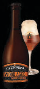
AMBRÉE GRAND CRU