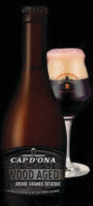
BRUNE GRANDE RÉSERVE MAURY