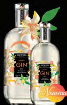
GIN BIO «FRAÎCHEUR AGRUMES» BOTANIKES ET ÉCORCES D'AGRUMES