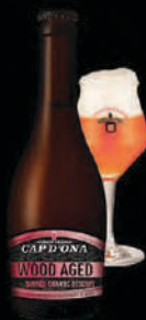
BLONDE GRANDE RÉSERVE BANYULS