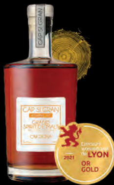
SPIRIT DE MALTS «CAP SI GRAN RÉSERVE 50» VIEILLI EN FÛT DE CHÊNE