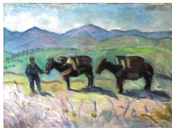
Charles Camoin Les ânes à Collioure - 1912 Huile sur toile - 65 x 81 cm