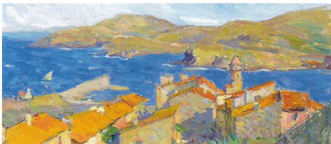
Henri Marre - Paysage de Collioure - vers 1915 - Huile sur toile - 60 x 73 cm