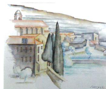
Léopold Survage Vue de Collioure - 1929 Aquarelle sur bois - 33 x 41 cm