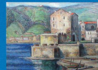
Jean Peské Port de Collioure - vers 1930 Aquarelle sur papier - 50 x 65 cm