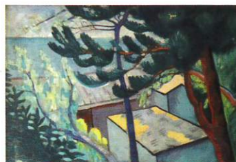
André Masson Collioure, paysage - 1919 Huile sur toile - 46 x 65 cm