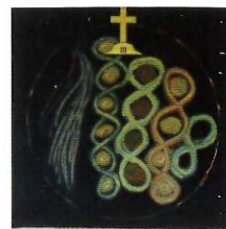
Jean-Louis Vila 3 ème station, Jésus tombe pour la 1 ère fois - 2005 Acrylique sur carton - 104 x 105 cm