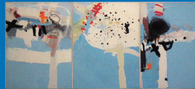
Jean Capdeville Sans titre, Triptyque - 1967 Acrylique sur toile - 145,5 x 324,5 cm