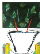
François Martin Florja - 1994 Acrylique, fusain, collages sur toile 81 x 60,5 cm