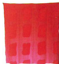
Claude Viallat Solarisation - 1989 Tissu solarisé - 153 x 161 cm