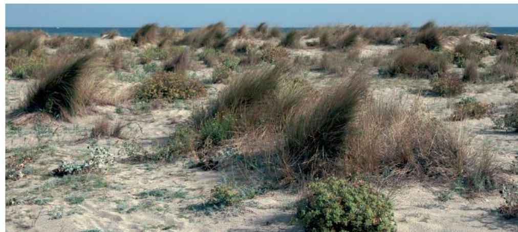
Le massif dunaire de la réserve naturelle

la sécheresse estivale, possède des feuilles dont la partie supérieure perd de sa turgescence au moment des grandes chaleurs. Cette particularité permet ainsi aux feuilles de s'enrouler pour garder l'humidité.