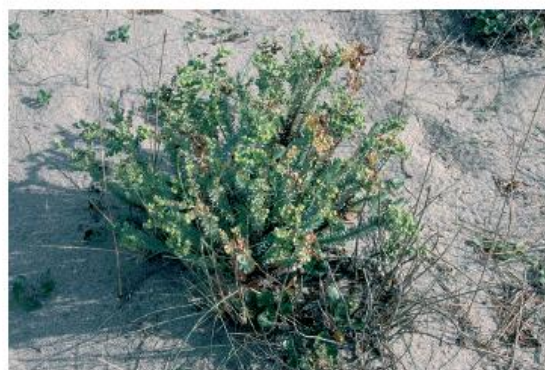
L'euphorbe des rivages

Avec la vigueur caractéristique des plantes envahissantes, les figuiers de barbarie ont un temps menacé l'équilibre des milieux originels. Grâce aux interventions ciblées de la Réserve naturelle du Mas Larrieu, leur prolifération est désormais enrayée.