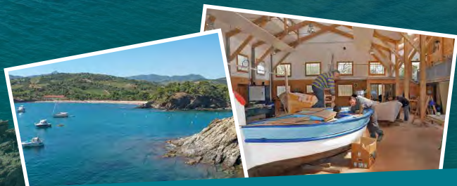
Hermeline MALHERBE Présidente du Département des Pyrénées-Orientales

Je vous invite à visiter l'atelier de restauration des barques catalanes, à découvrir l'exposition sur la mémoire ouvrière des lieux, à vous prélasser sur la plage ou flâner sur les chemins et surtout respecter cet environnement remarquable. Pour notre plaisir d'aujourd'hui... pour celui de nos enfants demain.