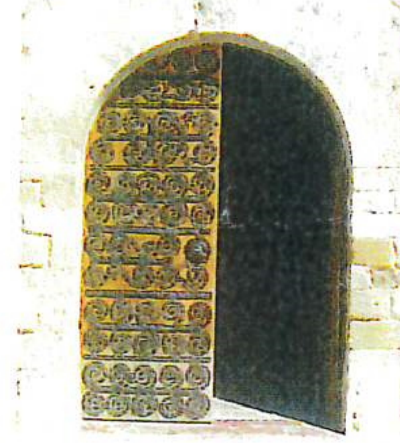
Eglise Sainte Marie