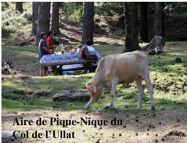
Aire de Pique-Nique du Col de l'Ullat