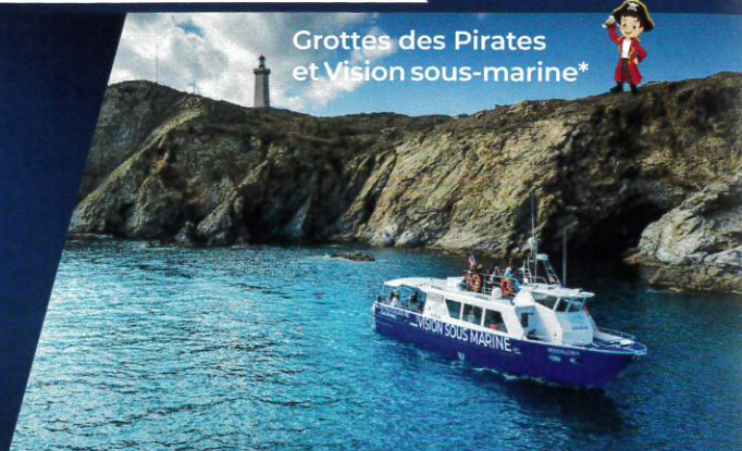
Grottes des Pirates et Vision sous-marine*

Une vue incroyable sur la côte Vermeille !