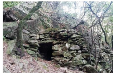
Un "Orri" - abri en pierres