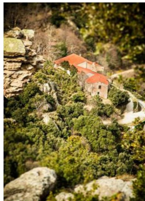
L'ermitage de Notre-Dame du Château

Rejoindre le Puig Naud en suivant le circuit ⑤ jusqu'au col ( panorama sur la vallée de Lavall, la Tour de la Massane, le Roc de les Medes ). La ruine du château est posée sur un piton rocheux qui peut s'escalader. Un départ possible se situe juste sous la partie voûtée ( nichée dans une fissure, masquée par un arbuste bien visible ). De là, de larges fissures permettent d'atteindre la ruine (+ de 12 ans). Rentrer dans la ruine... Descendre côté Est, par l'échelle scellée dans la roche pour arriver entre les deux Puigs et continuer assez rapidement en longeant le rocher pour passer côté Nord. Au pied de la paroi, un sentier assez bien marqué redescend à flanc, dans la combe, jusqu'à la chapelle.