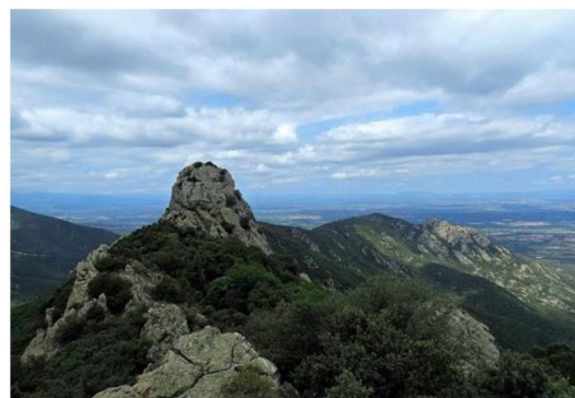
Roc de les Medes

La boucle peut se faire dans les 2 sens; la durée est la même. La luminosité étant meilleure le matin, il est conseillé aux amateurs de photo de commencer le circuit ⑤, pour profiter du panorama sur la mer et sur le massif du Canigou , et de rentrer à Sorède par la Vallée Heureuse .