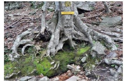
Font dels Miracles