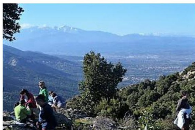
Près du Roc de les Medes