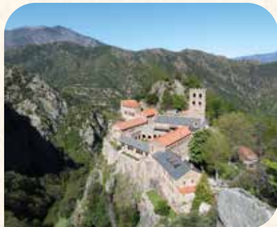
Tél. +33 (0)4 68 05 50 03 www.stmartinducanigou.org