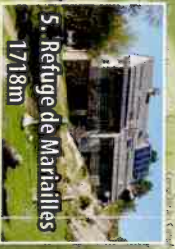
5. Refuge de Marailles 1718m