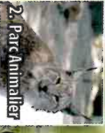
2. Parc Animalier