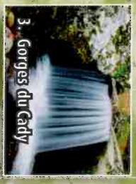
3. Gorges du Cady