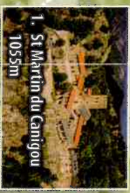
1. St Martin du Canigou 1055m