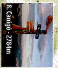
8. Canigou - 2784m