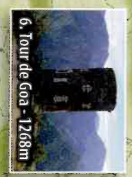
6. Tour de Goa - 1268m