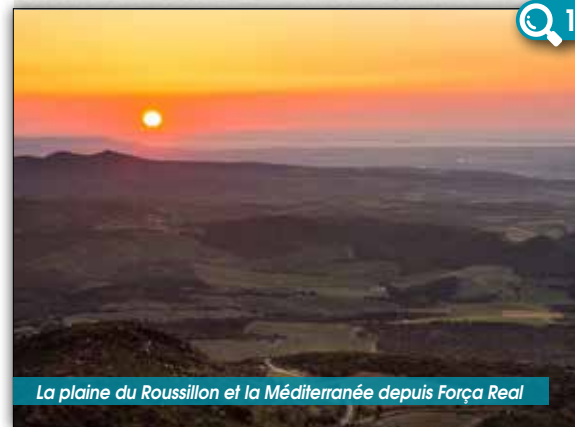
La plaine du Roussillon et la Méditerranée depuis Força Real