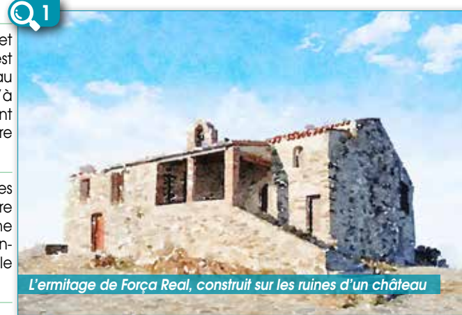
L'ermitage de Força Real, construit sur les ruines d'un château

Reprenez le chemin suivi à l'aller pour rejoindre Millas.