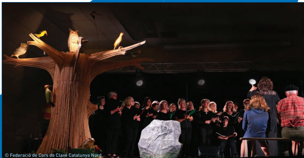
© Federació de Cors de Clavé Catalunya Nord

Théâtre municipal Jordi Pere Cerdà Spectacle tout public. Durée : 60 minutes. Entrée libre et gratuite dans la limite des places disponibles.