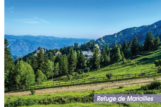
Refuge de Marialles

3 Coll del Cavall Mort (1458 m). Continuer en face sur le sentier. Quelques mètres plus loin, remarquer un orri (cabane de berger en pierres sèches) et les ruines d'une ancienne bergerie. Laisser alors le chemin qui mène vers la Jaça de Morà et continuer sur le GR®10. Le sentier suit un ruisseau que l'on quittera par la droite après avoir traversé le Canal del Rander. Ignorer ensuite le sentier qui relie l'ancien parking du Rander et continuer tout droit. Remarquer un orri et remarquer une petite cascade avant de traverser le Canal del Sahuc.