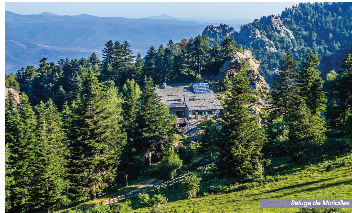
Refuge de Mariailles

Une belle balade en approche du refuge de Mariailles empruntant le célèbre GR®10, révélant sources et passé pastoral du massif du Canigó.