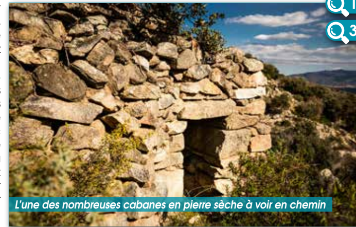
L'une des nombreuses cabanes en pierre sèche à voir en chemin

5 Quittez-la, et 200 à 300 mètres plus loin vous pourrez visiter d'autres cabanes avant de rejoindre l'une des 2 intersections avec le chemin de l'aller. Prenez le sentier sur votre droite jusqu'à la seconde intersection et rejoignez votre point de départ en suivant le chemin précédemment emprunté.