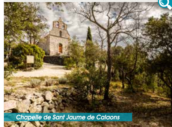
Chapelle de Sant Jaume de Caloons