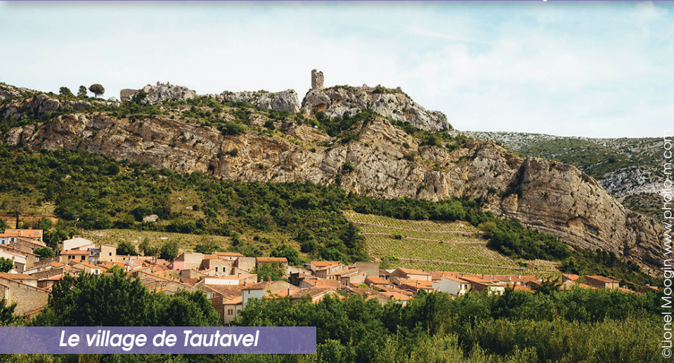
Le village de Tautavel