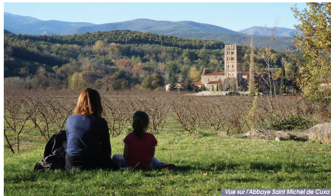
Vue sur l'Abbaye Saint Michel de Cuxa

En mai, voir le Jardin des Iris dans l'enceinte de l'Abbaye Saint-Michel-de-Cuxà l'Abbaye (IX ème / X ème siècle), qui est un des rares témoignages du passage de l'Art Préroman à l'Art Roman, doit sa renaissance en 1950 au violoncelliste Pablo Casals.