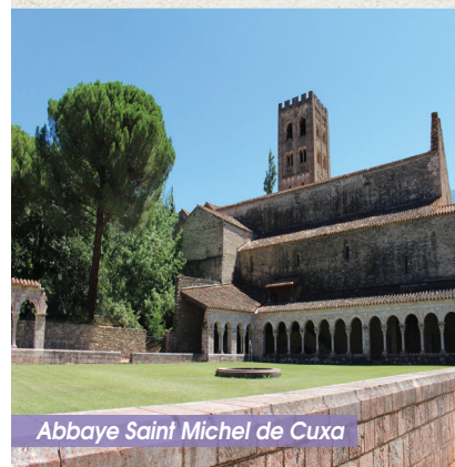
Abbaye Saint Michel de Cuxa

En 1919, Cuxa renaît de ses ruines. Il est racheté et mis à la disposition des moines cisterciens de Fontfroide qui rentrant d'exil, y demeurèrent jusqu'en 1965. Entre temps, vers les années 50, le célèbre violoncelliste catalan Pau Casals, exilé volontaire à Prades, avait donné des concerts pour la restauration de l'abbaye. Depuis lors une communauté de moines bénédictins de Montserrat poursuit dans ces lieux une vie monastique commencée il y a onze siècle.