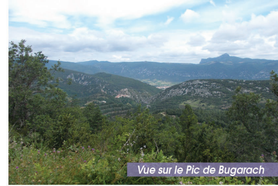
Vue sur le Pic de Bugarach