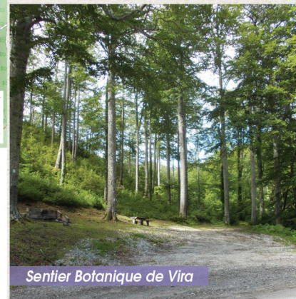
Sentier Botanique de Vira