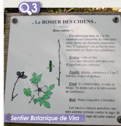
Sentier Botanique de Vira

Historiquement exploité pour transformer le bois en charbon pour la production de verre et de fer, le massif continue de produire une précieuse matière première pour nos maisons ou nos meubles tout en étant gérée durablement.