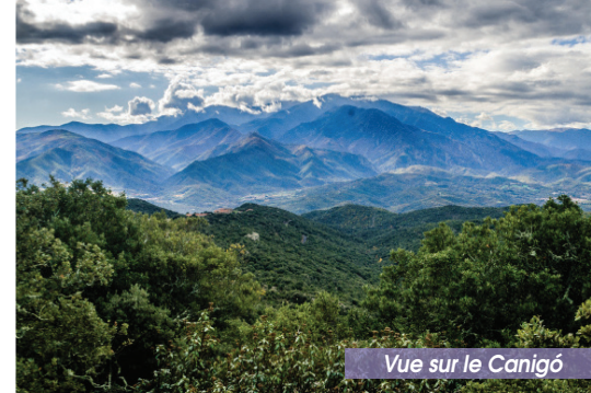
Vue sur le Canigó

⑤ Début du chemin bitumé qui ramène au Point de départ. A gauche, sentier qui mène (200 m) à la « Chapelle Ste Eulalie (Capella de Santa Euralia) ».