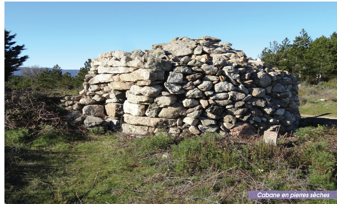
Cabane en pierres sèches