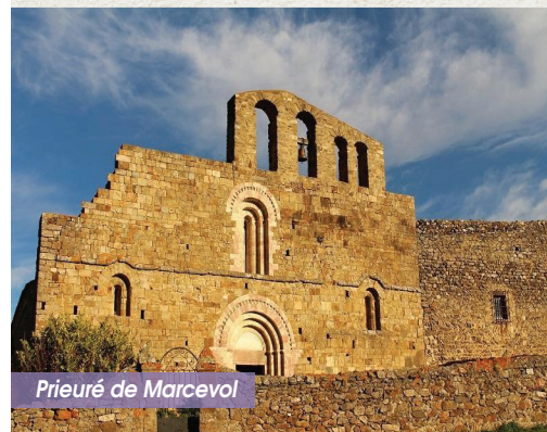
Priuré de Marcevol

Sur un balcon rocheux face au Canigou, le Priuré de Marcevol fut fondé au XII ème siècle par les Chanoines du Saint-Sépulcre, ordre monastique lié à la conquête des lieux Saints. L'église romane à trois nefs se distingue par sa façade géométrique et par son portail orné de marbre rose de Villefranche. Dominant les vallées de la Catalogne romane, ce lieu de pèlerinage ouvre ses portes aux visiteurs pour une initiation à l'art roman.