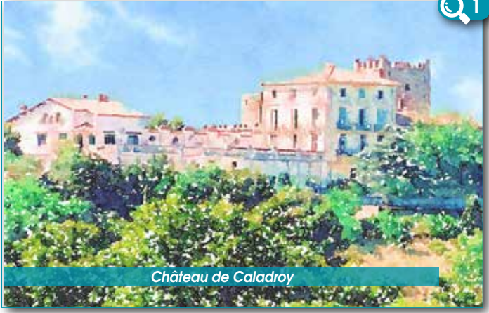
Château de Caladroy

6 Sur la piste prenez par la gauche sur moins d'une centaine de mètres, puis sur votre droite. Le chemin toujours de même direction se prolonge sur 300 m, puis s'oriente est-nord-est et rejoint l'intersection du chemin de l'aller. Vous êtes bientôt arrivé.