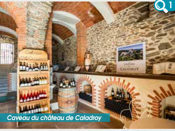
Caveau du château de Caladroy