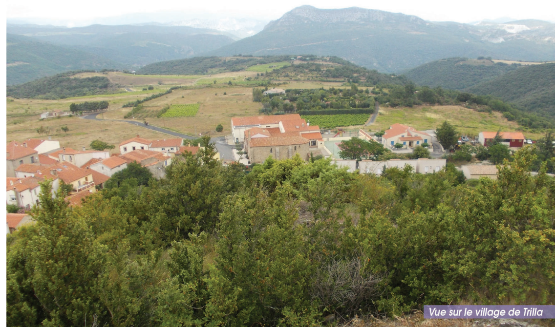
Vue sur le village de Trilla

Cette randonnée invite à la découverte des plateaux de Taupels et du Camp del Prat avec leurs dolmens Las Colombinos et Las Apostados, témoins d'une implantation humaine très ancienne, en passant par une table d'orientation au-dessus de Trilla.