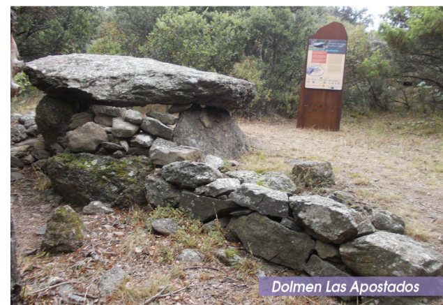
Dolmen Las Apostados

Quitter la piste et poursuivre en face entre une clôture en pierres et une vigne. Au fond de la vigne, continuer sur un sentier en descente qui rejoint un sentier perpendiculaire. Partir à gauche. Le sentier descend dans la forêt de chênes pour gagner la D9 ; la suivre à droite (prudence !) jusqu'au parking.