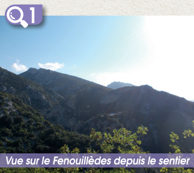
Vue sur le Fenouillèdes depuis le sentier