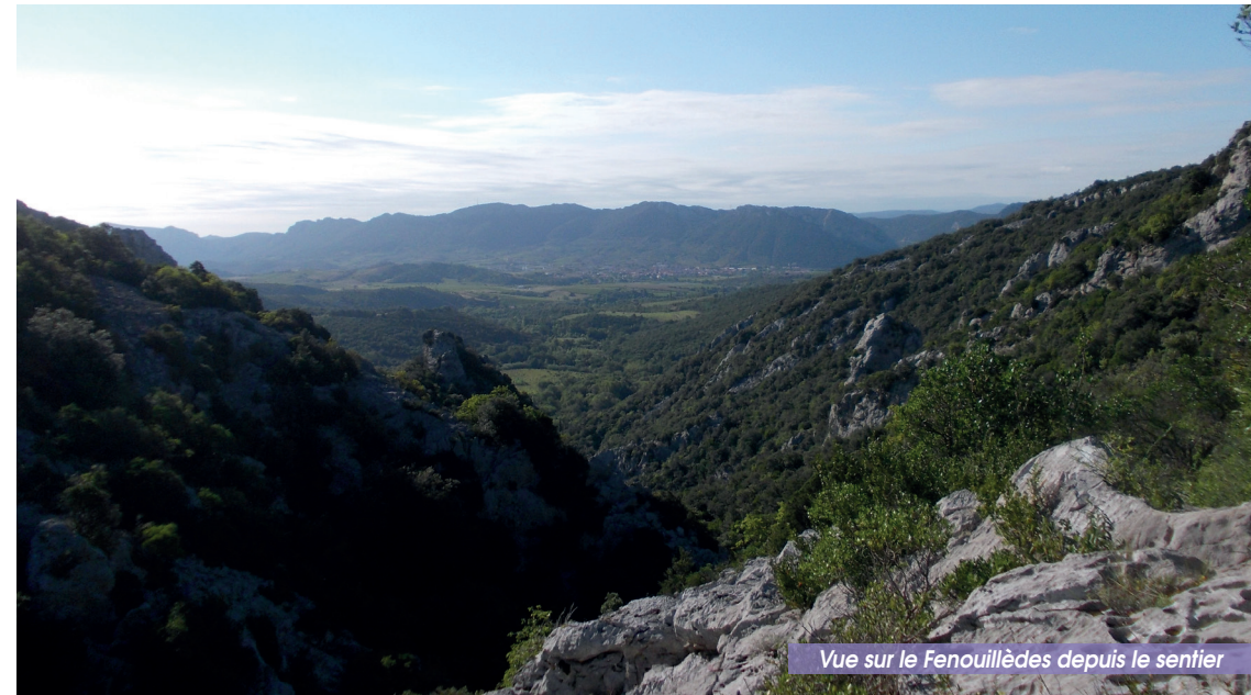
Vue sur le Fenouillèdes depuis le sentier

Recommandation : Balade longue sur un terrain souvent inégal. Etre attentif au balisage dans la 1 ère partie lors de la traversée de pierriers (passage court équipé d'une main courante).