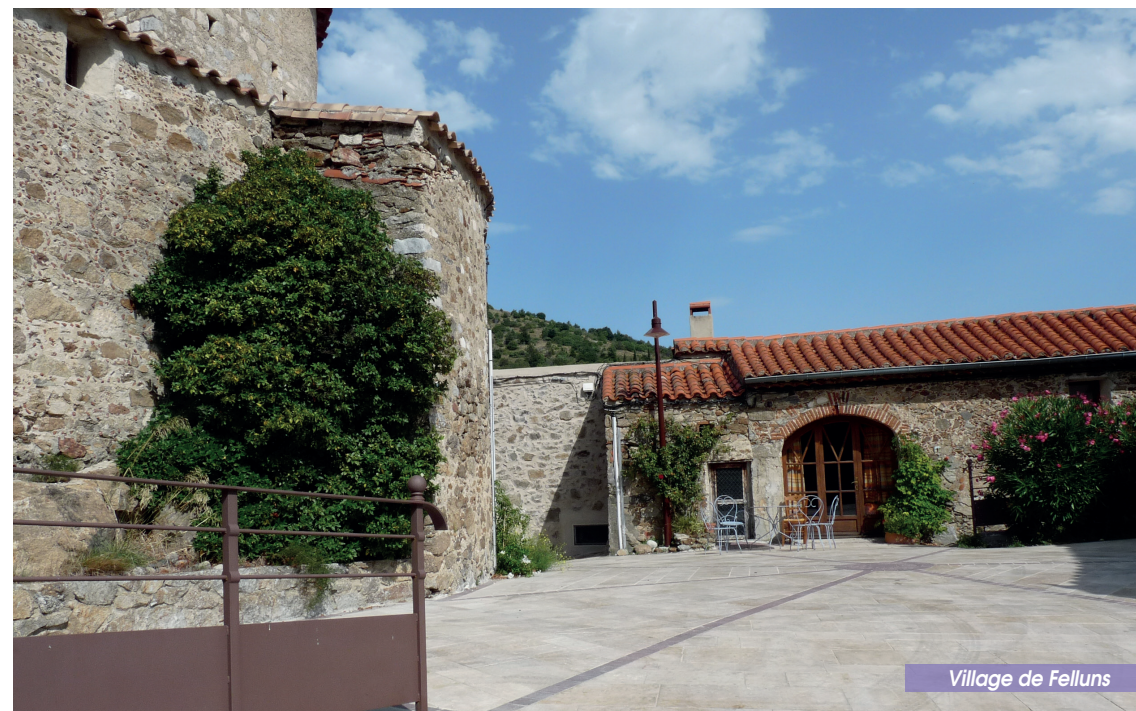
Village de Felluns