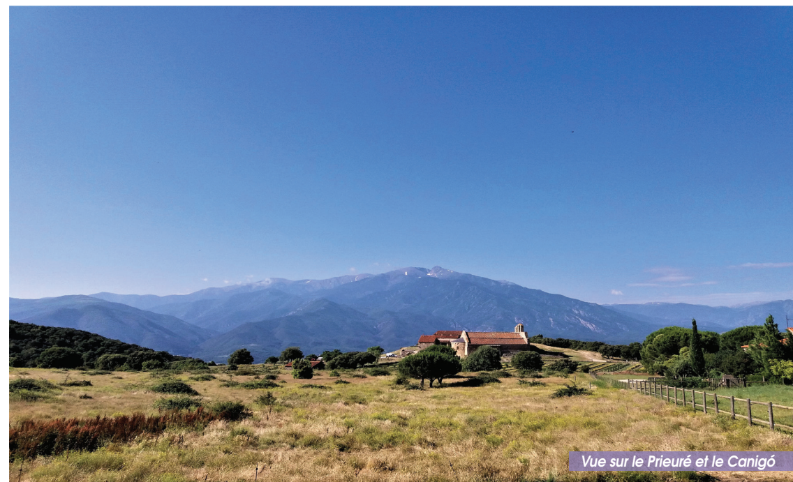
Vue sur le Prieuré et le Canigó