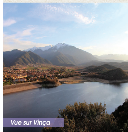
Vue sur Vinça