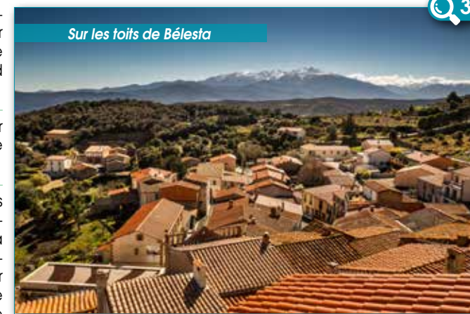
Sur les toits de Bélesta

7 Prenez à gauche et 100 mètres puis loin, au niveau de la table d'orientation, prenez sur votre droite la route sur 1,4 km. Après le grand lacet, continuez sur votre gauche par le chemin de Regleilla jusqu'au site des Orgues. De là, suivez l'itinéraire laissé à l'aller.