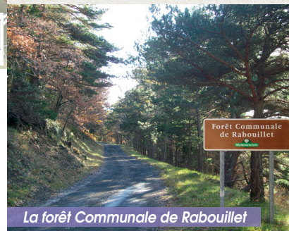
La forêt Communale de Rabouillet