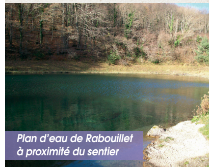
Plan d'eau de Rabouillet à proximité du sentier