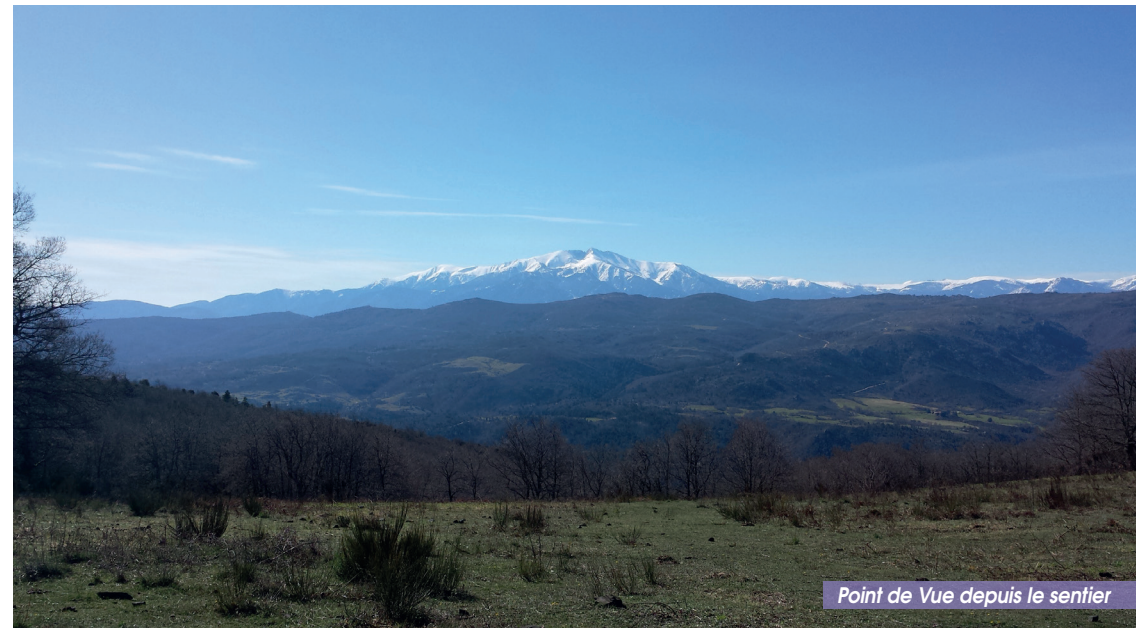
Point de Vue depuis le sentier