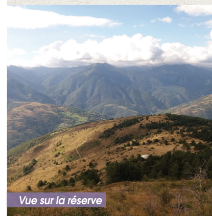
Vue sur la réserve

La richesse floristique de la réserve est le résultat de plusieurs facteurs : les influences climatiques, la diversité des milieux naturels (falaises, forêts, landes, pelouses...) et les activités pastorales passées et présentes. Ainsi, au détour d'un chemin vous pourrez rencontrer, le chène vert dans les parties basses, la spiranthe d'été et la grassette insectivore dans les zones humides; le pin sylvestre se trouve au dessus de 1600m.