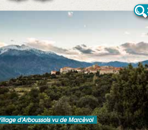
Village d'Arboussols vu de Marcèvol