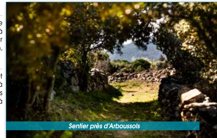
Sentier près d'Arboussols

6 Tournez sur votre gauche et continuez sur 750 mètres jusqu'à l'intersection laissée à l'aller, puis retraversez le pont pour revenir à votre point de départ.