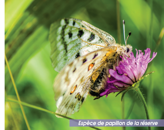
Espèce de papillon de la réserve

③ Estany del Clot. Prendre le sentier sur votre droite qui vous mène au bord du lac. De belles vues s'offrent sur le lac, le Mont Coronat et le Massif du Canigó. Le retour au parking se fait à par le même sentier.