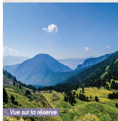
Vue sur la réserve