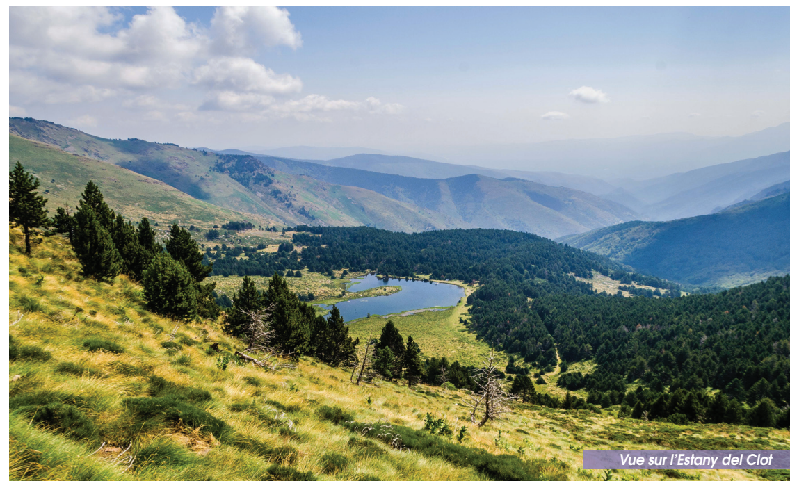
Vue sur l'Estany del Clot