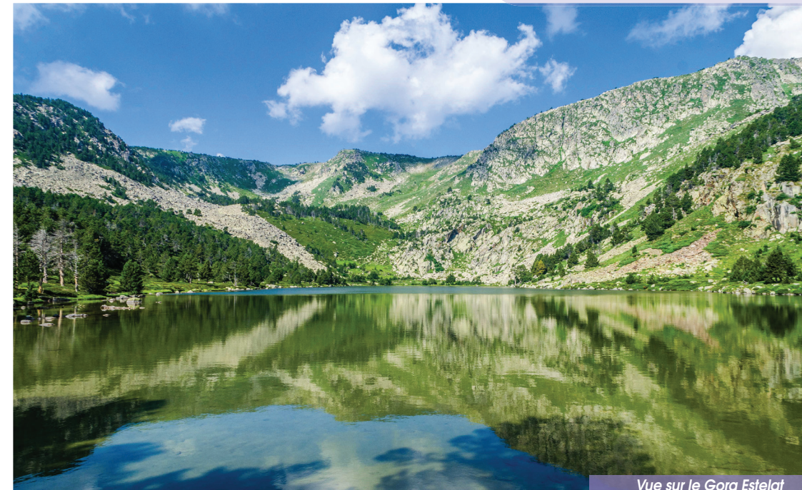
Vue sur le Gorg Estelat