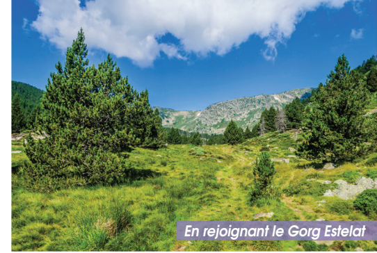
En rejoignant le Gorg Estelat

7 Coll de Portus. Suivre la piste qui descend sur la gauche et vous ramène à la bifurcation des pistes sous l'Estany del Clot. Le retour au parking se fait à par le