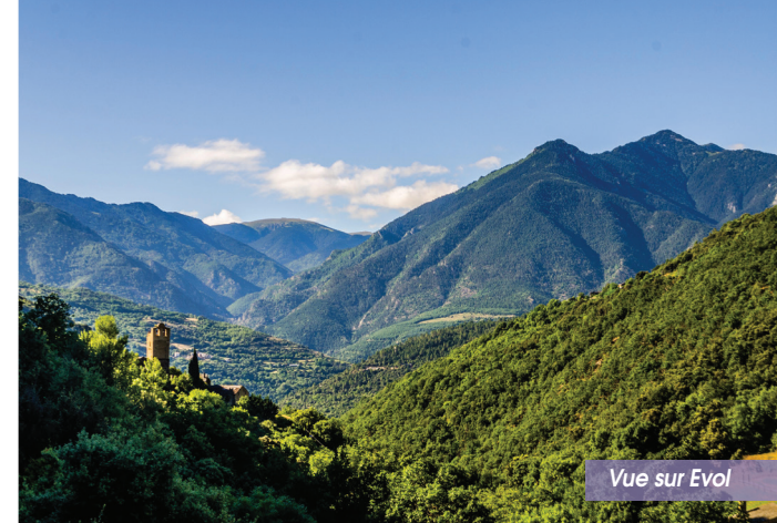
Vue sur Evol