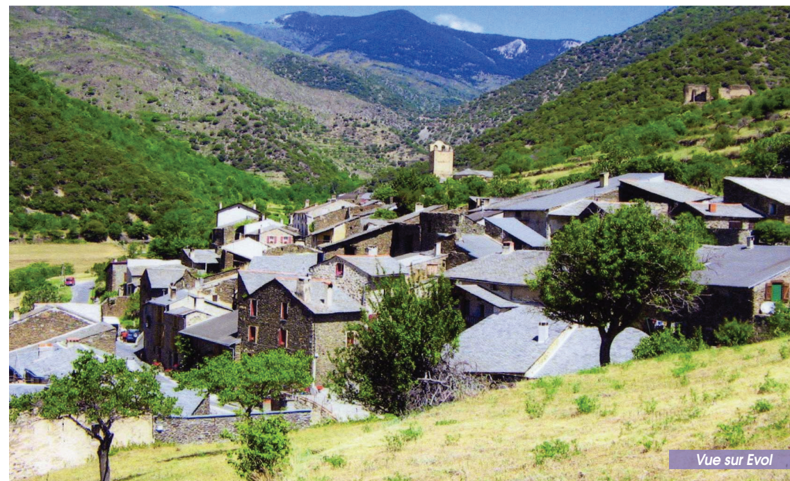
Vue sur Evol