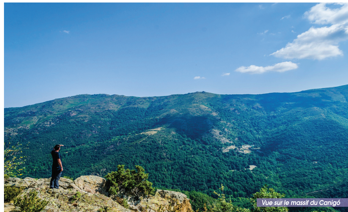
Vue sur le massif du Canigó

Belle boucle entre deux villages de la vallée de la Llentillà. Sur les contreforts du Canigó, partez à la découverte de l'histoire de ces deux villages.