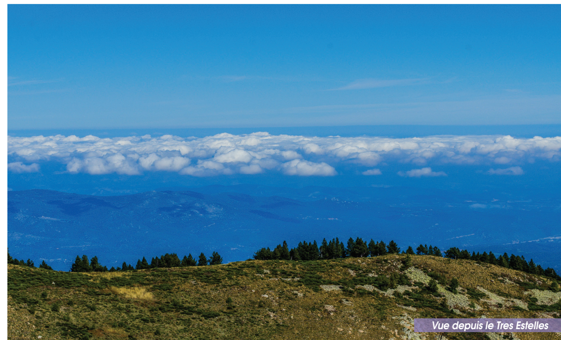
Vue depuis le Tres Estelles