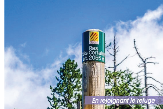
En rejoignant le refuge