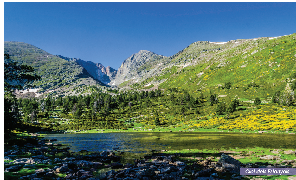
Clof dels Estanyols

Une belle ascension pour la Montagne Sacrée des Catalans, premier haut pic des Pyrénées côté est. Depuis le Canigó, de beaux panoramas s'offriront à vous sur la chaîne des Pyrénées, la Méditerranée et les plaines alentours.