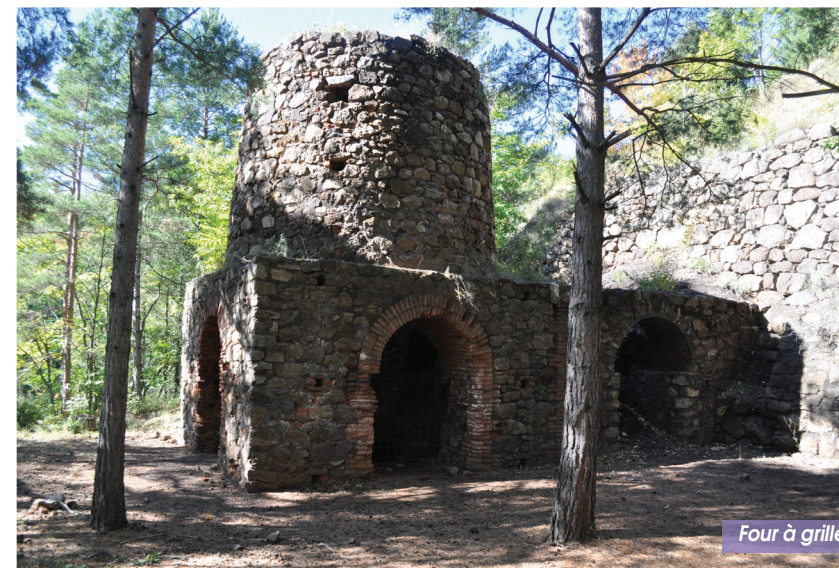
Four à griller