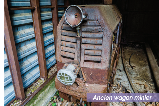
Ancien wagon minier

7 Intersection avec le « GR@T83 ». Prendre le sentier à gauche (épingle à cheveux) pour arriver sur une branche du Canal de Bohère (Correc Boera), souvent asséchée. Après 600 m, le long du canal, prendre le sentier qui descend à droite ( ancien chemin rural de Saint-Michel-de-Cuxà à Fillols ). Passage de la « Litéra » sur une passerelle avant de remonter vers le parking de l'Abbaye. Prendre la « D27 » à droite, en contournant l'Abbaye pendant 50 m, puis suivre le sentier qui part à gauche et longe des vergers de pêcheurs.