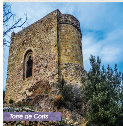
Torre de Corts