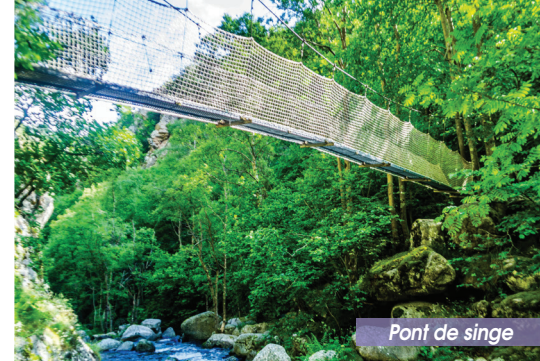
Pont de singe

④ Variante : Après 1,50kms de descente, laisser l'itinéraire et partir par une sente qui remonte à droite, balisée en jaune. Après être monté quelques minutes sur un sentier très escarpé, la sente redescend et dévoile des points de vue sur les corniches et les falaises.