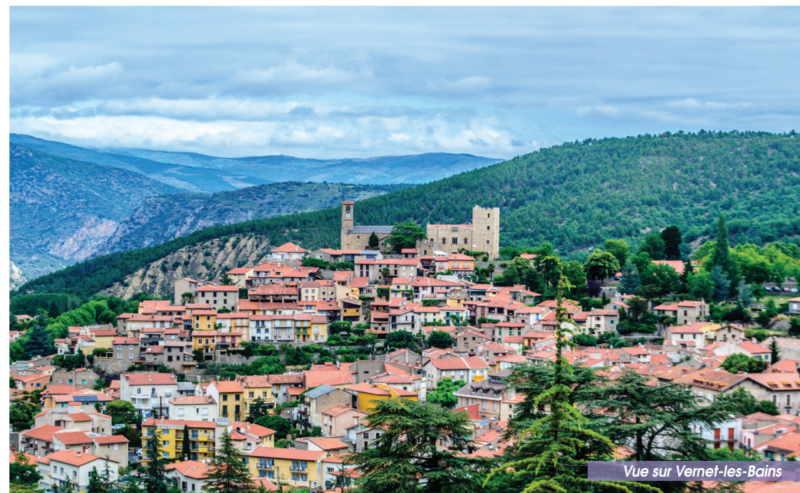
Vue sur Vernet-les-Bains

OFFICE DE TOURISME PLACE DE LA RÉPUBLIQUE