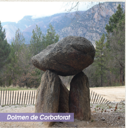
Dolmen de Corbatorat