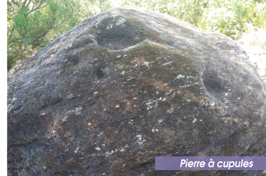
Pierre à cupules

7 Le Cami Saint Jaume (direction Vernet-les-Bains) sur 200 m, puis tourner à gauche entre 2 maisons. Prendre le sentier cimenté, puis en terre, qui rejoint un canal d'arrosage. Le suivre à gauche sur une dizaine de mètres. Le sentier repart à droite perpendiculairement au canal par une montée très rude jusqu'à la piste du Cami du Sola.