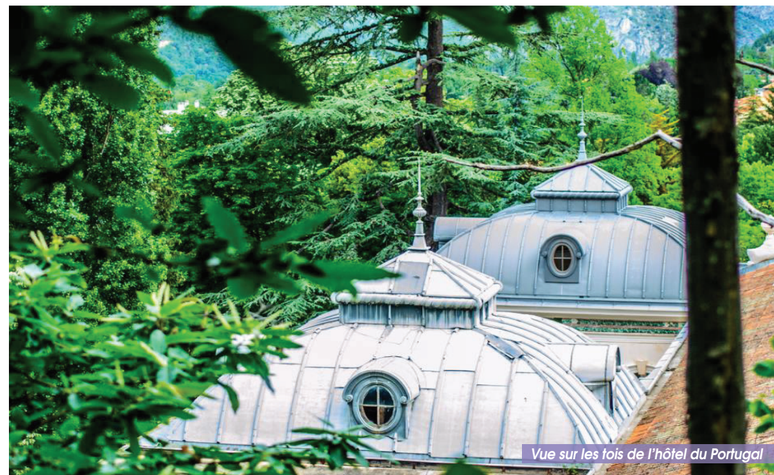
Vue sur les toits de l'hôtel du Portugal

Panoramas et patrimoine Balade familiale offrant de beaux points de vue sur le Vernet-les-Bains de la belle époque.