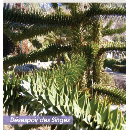
Désespoir des Singes