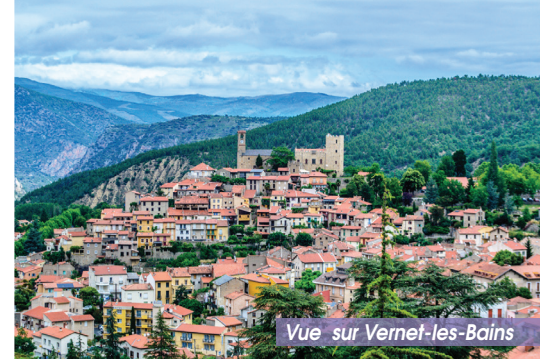
Vue sur Vernet-les-Bains