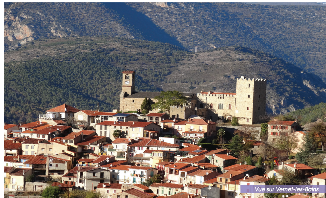
Vue sur Vernet-les-Bains

OFFICE DE TOURISME - PLACE DE LA RÉPUBLIQUE