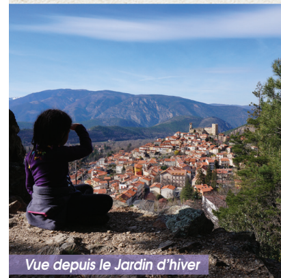
Vue depuis le Jardin d'hiver

Puis la nature a repris ses droits et il a sombré doucement dans l'oubli. Réhabilité à la fin du XXe siècle par les membres de l'association Camivern, il permet à nouveau de s'élever sans effort jusqu'au Belvédère qui offre une vue unique sur Vernet-les-Bains et sa vallée.