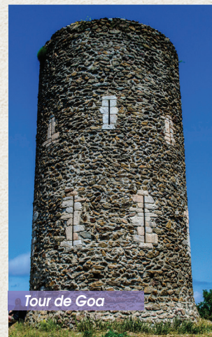
Tour de Goa