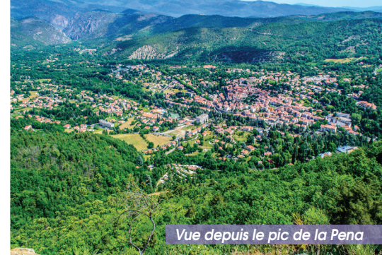
Vue depuis le pic de la Pena

5 Pic de la Pena – 1h25 – 1062 m. Point de vue sur les vallées du Cady, de la Rotja, le Massif du Canigó... Redescendre par le même chemin et prendre à l'intersection le sentier à droite qui descend en lacets (balisage jaune). Au cours de la descente, petit col avec vue sur la vallée du Cady et Saint-Martin-du-Canigó (vers la droite) puis intersection avec un sentier horizontal, tracé sur l'ancienne voie ferrée étroite des mines de fer.)