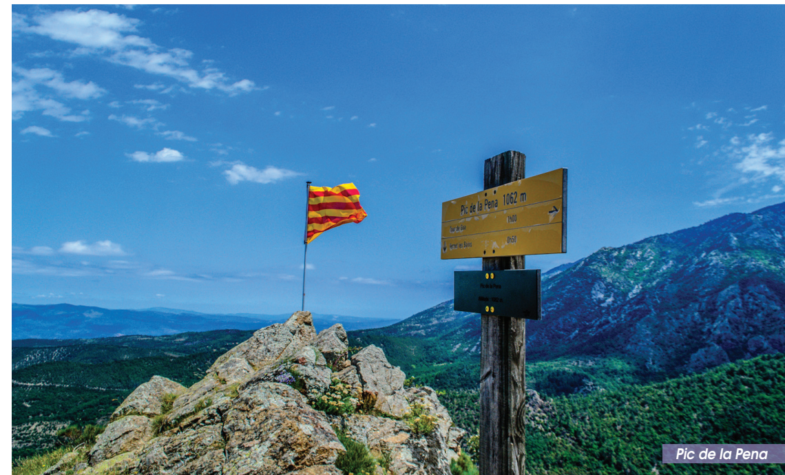
Pic de la Pena