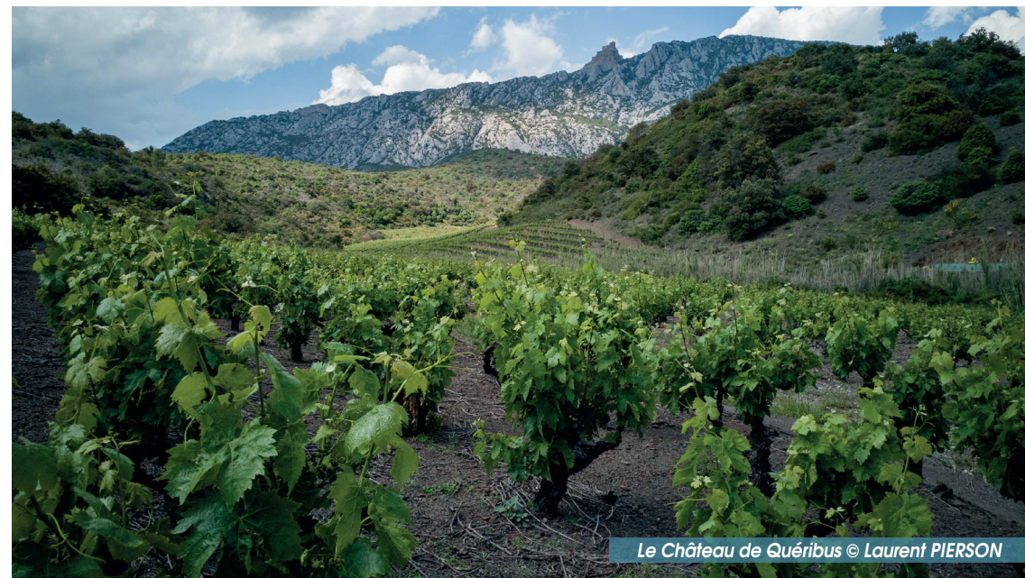
Le Château de Quéribus

Recommandation : Attention au franchissement du passage à gué. Des passages parfois techniques.