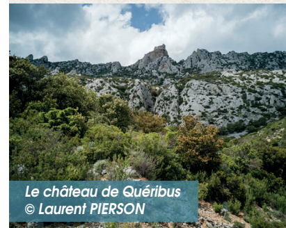
Le château de Quéribus