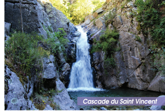
Cascade du Saint Vincent

Cascade des Anglais – 1h20 – 978 m. Retour par le même itinéraire jusqu'à l'escalier. Continuer sur le « chemin de la Forêt et du Saint-Vincent » (longer le cimetière) jusqu'à la route de Fillols. Prendre à gauche en direction de la mairie, le château et l'église et suivre le balisage jaune et rouge. Après la mairie, commencer, à gauche, la descente dans le Vieux Village jusqu'à la Place de la République.