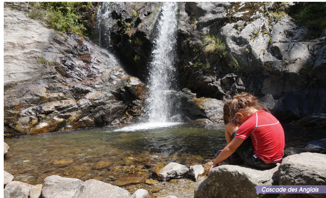
Cascade des Anglais

Attention, ce circuit encaissé présente des risques de chutes de pierres ou de rochers. Respecter la signalisation. Ne doit pas être emprunté par risque d'orage ou de pluie ou en période de crues. Sentier rocailleux. Chaussures de randonnée vivement conseillées. Notez que le sentier est inaccessible du 30 septembre au 1er avril (arrêté municipal en vigueur).