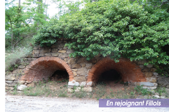
En rejoignant Fillols