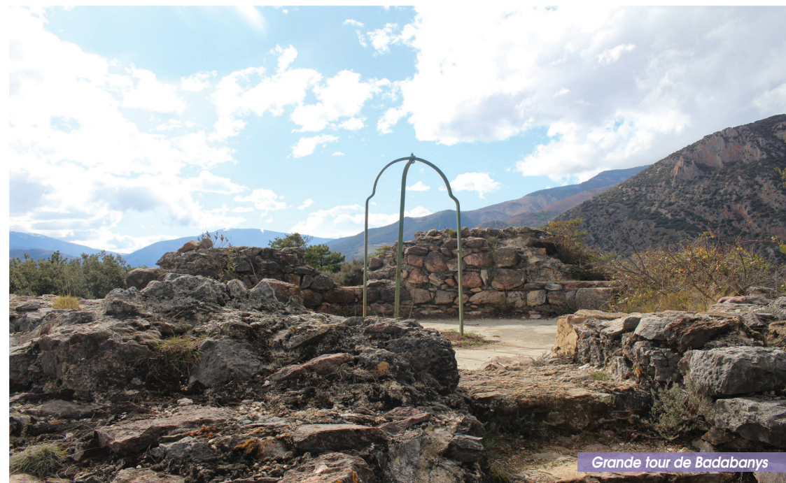
Grande tour de Badabany

OFFICE DE TOURISME PLACE DE LA RÉPUBLIQUE