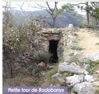
Petite tour de Badabany

Un peu plus bas au Nord-Est, la «petite tour», également ruinée, a tiré partie du relief pour être protégée par un profond fossé. En 1346 Pierre IV d'Aragon, qui réorganise le fonctionnement de la grande tour (Élément essentiel à grand rayon d'action) ordonne la mise hors service de la petite tour (Desserte locale de Villefranche en fond de vallée) et en fait murer la porte.