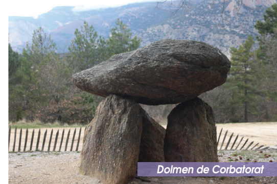
Dolmen de Corbatorat