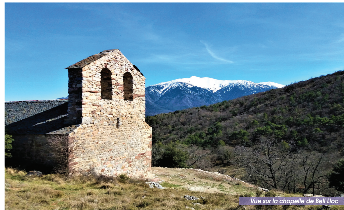
Vue sur la chapelle de Bell Lloc

BUREAU DE L'OFFICE DE TOURISME CONFLENT CANIGÓ À VILLEFRANCHE- DE-CONFLENT OU GARE SNCF DU TRAIN JAUNE.