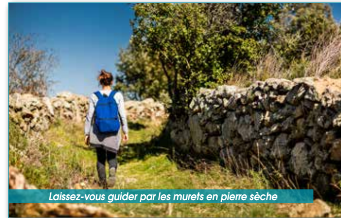
Laissez-vous guider par les murets en pierre sèche

3 De l'intersection, laissez sur votre droite le chemin de la boucle qui mène à Arboussols et prenez le chemin de gauche. Continuez en direction du sud-est sur 850 mètres, puis vers l'est jusqu'à l'intersection avec le chemin emprunté à l'aller. Reprenez le sentier suivi à l'aller pour revenir à votre point de départ.