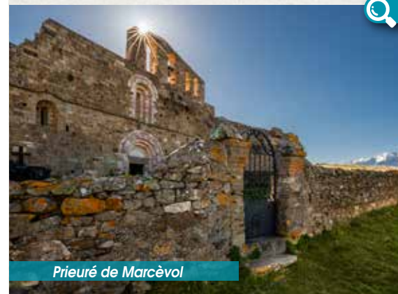
Prieuré de Marcèvol