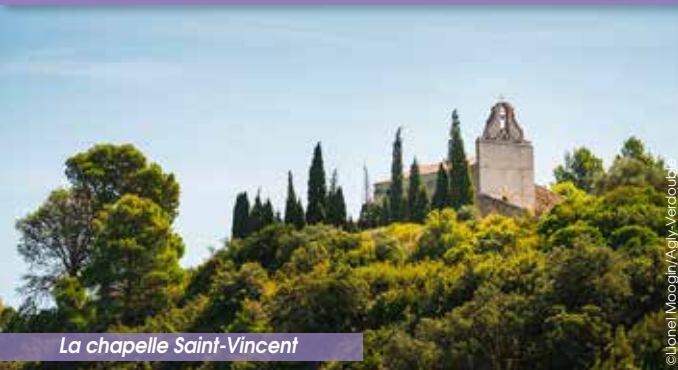
La chapelle Saint-Vincent