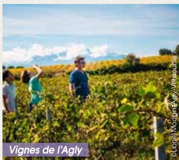
Vignes de l'Agly