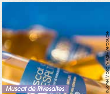
Muscat de Rivesaltes

La viticulture doit beaucoup à François Arago, un physicien et homme politique beaucoup. En effet, il fit reconnaître une sorte « d'exception culturelle » aux vins doux du Roussillon, leur permettant ainsi d'échapper à une fiscalité pénalisante. Cette décision sera confortée par la loi Pams en 1898 qui fit apparaître la dénomination VDN (Vins Doux Naturels). Ces vins sont naturellement riches en alcool, en sucre et en arômes. Ils sont produits grâce à un procédé consistant à arrêter la fermentation du moût en rajoutant de l'alcool de vin, permettant ainsi au vin de garder une partie importante des sucres et des arômes naturels des raisins. La région de Perpignan est la plus importante productrice de VDN, grâce entre autres, aux célèbres Banyuls, Maury, Rivesaltes et Muscat de Rivesaltes.