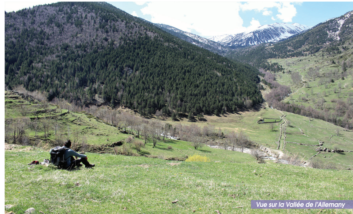
Vue sur la Vallée de l'Allemany

OFFICE DE TOURISME CONFLENT CANIGÓ - VINÇA