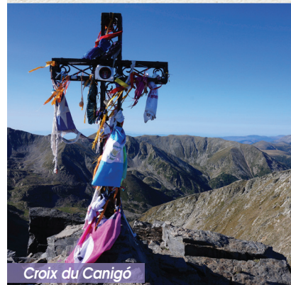
Croix du Canigó