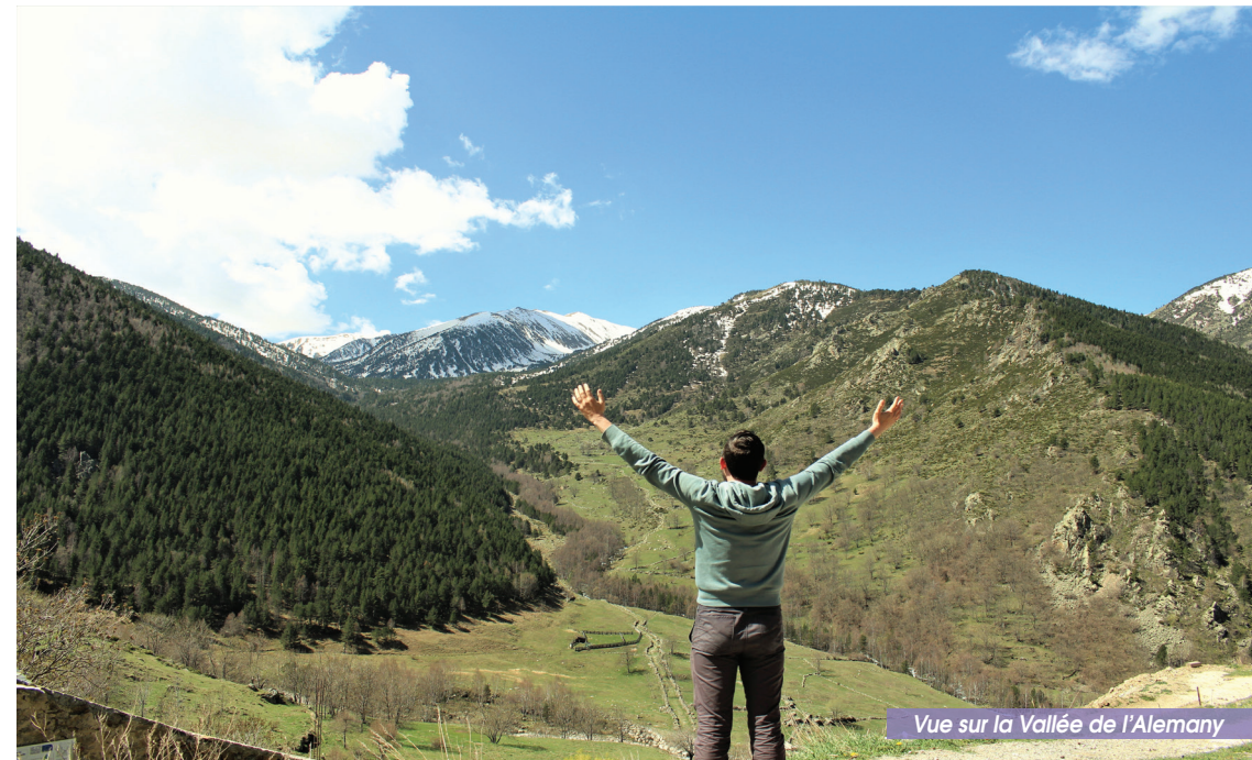
Vue sur la Vallée de l'Alemany

Phare de la Méditerranée, célébrant l'Orient des Pyrénées, le Canigó est un massif de légendes. Terre d'itinérance et de spiritualité, il invite ses visiteurs à vivre les émotions des grands espaces, la liberté, l'évasion. Prenez le temps de vous ressourcer dans ce massif mythique qui vous contera son histoire.